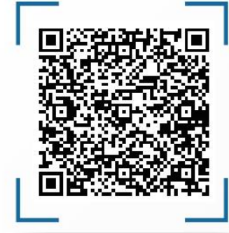
تقرير القناة العربية