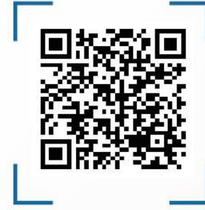
اعلان انطلاق البرنامج