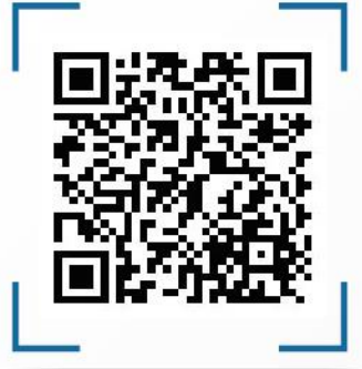
شركة البحر الأحمر للتطوير